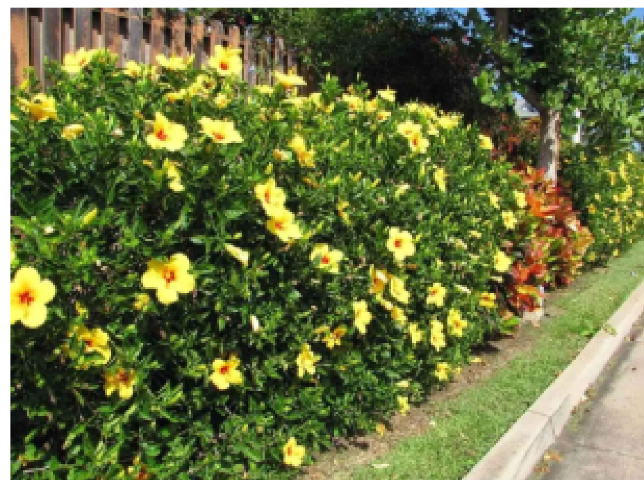
Cerca viva de Alamandra